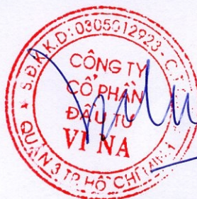
BÙI MINH TUẤN

(Ký, ghi rõ họ tên, đóng dấu – nếu có) ( Signature, full name and seal – in case of organization )