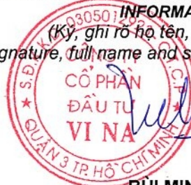
BUI MINH TUẤN

(Ký, ghi rõ họ tên, đóng dấu - nếu có) (Signature, full name and seal - in case of organization)